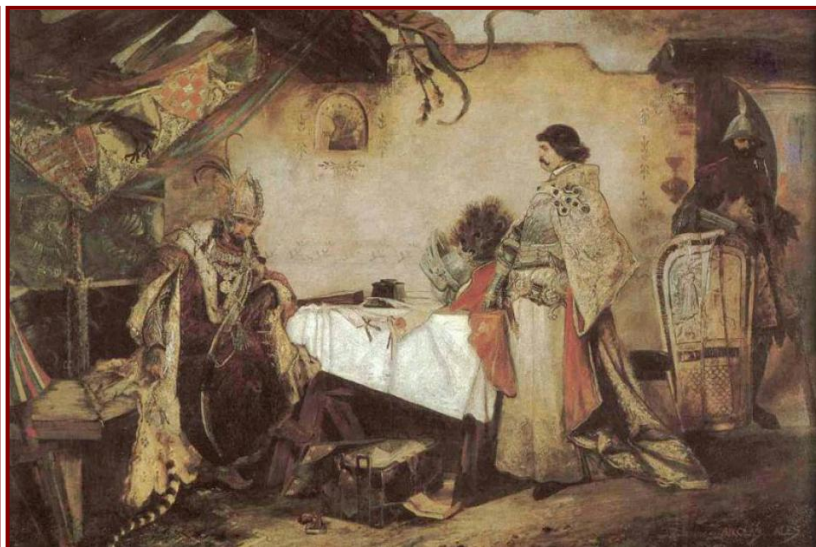
Setkání Jiřího z Poděbrad v Uhrově s Matyášem Korvínem Autor kresby: Mikoláš Aleš

Jiřího snaha o řešení sporů mezi národy především bezkonfliktně bez použití síly, je dodnes stále inspirující, neboť, i přes vznik OSN a EU, zažíváme i v 21. století řešení některých konfliktů násilnou cestou.